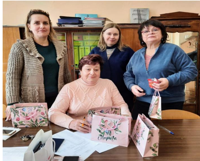
Поздравление детей членов Профсоюза и вручение Новогодних подарков