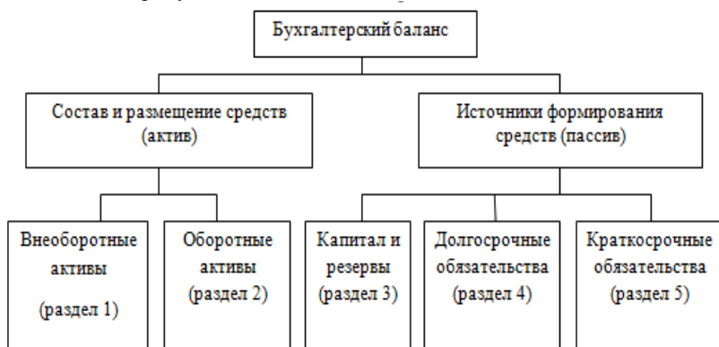
Рисунок 1 – Структура бухгалтерского баланса

Представим графически внешний вид бухгалтерского баланса организаций на рисунке 1.