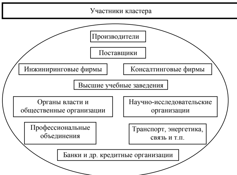
Рисунок 1 - Участники кластера

- происходит возникновение новых деловых структур внутри кластера благодаря информированности о существующих нишах в производстве продукции и услуг, способах реализации, концентрации и доступности любых необходимых для образования предприятия ресурсов, в том числе информационных;