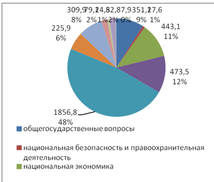
Рисунок 2 - Структура расходов местных бюджетов РФ в 2019 г.

В 2019 году общий объем расходов местных бюджетов превысил объем доходов местных бюджетов на 36,5 млрд. рублей (в 2018 году расходы местных бюджетов превысили доходы на 10,0 млрд. рублей). При этом в 25 субъектах Российской Федерации местные бюджеты исполнены с профицитом, который составил 9,0 млрд. рублей, в 60 субъектах Российской Федерации – с дефицитом в сумме 45,5 млрд. рублей.